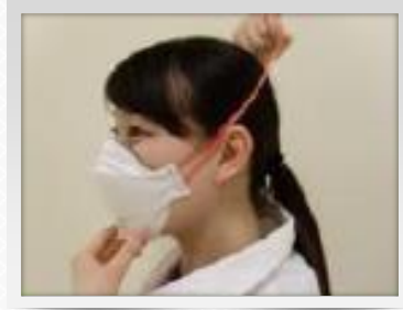
특수 마스크 착용