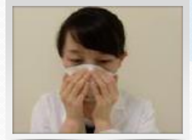
후~~불어 공기누설 체크